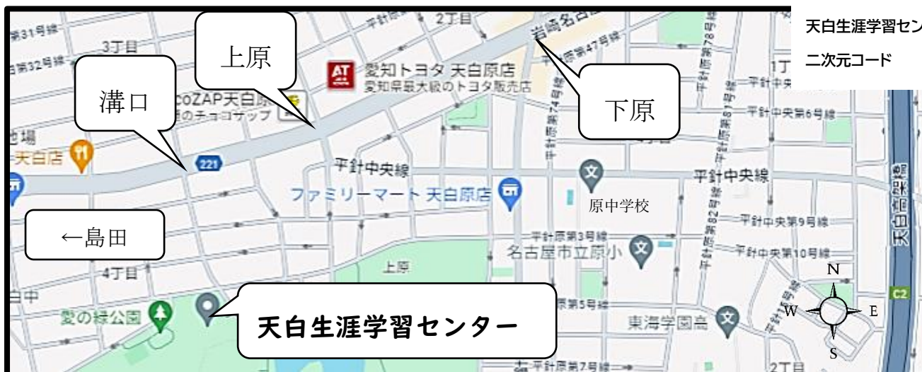
天白生涯学習センター地図 二次元コード