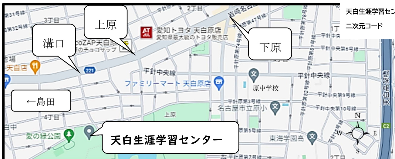
天白生涯学習センター地図 二次元コード