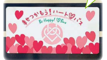
バスの前面のこのステッカーが目印

交通局ではハート♡バスに乗車して起きた「幸せ体験」を募集しています。採用された方にオリジナルステンレスボトルをプレゼントします。詳しくは名古屋市交通局乗客誘致推進課(972-3928)までお問合せください。