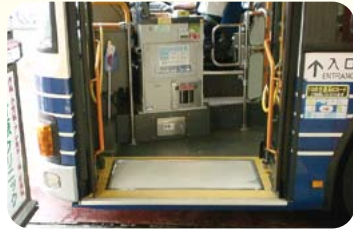
ノンステップバスの乗車口の様子