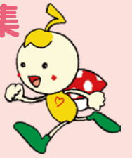
天白区社会福祉協議会 公式キャラクター てんてん