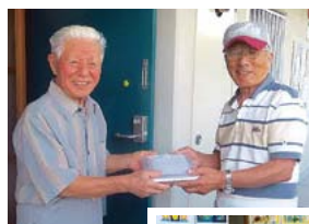
ひとり暮らしの高齢の方にボランティアの手作りお弁当を配達。