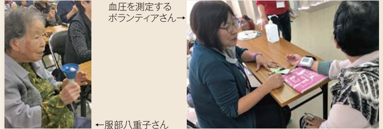
血圧を測定するボランティアさん→

A2. 長寿の秘訣は、はつらつで体操をしたり、みなさんと楽しくお話しをしたりすることです。家にいるよりも、外へ出て楽しむことが大切です。