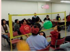
風船バレー交流会