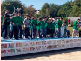
福祉区民のつどい

ふれ愛ネット天白は、『誰もが安心して暮らすことのできる天白区をめざして』を合言葉に天白区内の障がい児者・子ども・高齢者に関わるボランティア・団体・施設等が所属するゆるやかなネットワークです。今年も区民の皆さんにより多く参加していただけるような行事を企画したり、参加団体の交流見学会を開催したりしていきます。