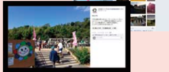
先日開催された「第29回天白区福祉区民のつどい」の写真アルバムもあります!