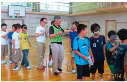
▲アイマスク体験 アイマスクを装着して、友達のガイドで校内へ出発

A とにかく怖かったです。でも、友達が「段差があるよ」とか声をかけながら、ガイドしてくれると、周りの様子が何となくわかって、安心感がありました。