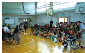
▲車いすの構造や使用方法の説明を聞く児童

1世帯あたりの人数が減る中で、3世代同居の家庭が減ってきています。また、障がいのある方との接点も少ない状況です。天白区社会福祉協議会では、障がいのある方やボランティア活動者の協力のもと、小中学校等で福祉体験学習を実施しています。体験や講話を通じて、高齢者や障がいのある方の身体的特徴や日常生活を知るとともに、手助けの方法を学びます。