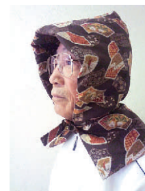
気持ちのこもったボランティアのお手製防災頭巾