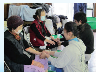
被災地でのボランティアの様子

※10月には災害ボランティア養成講座、11月には、災害ボランティアセンター設置運営訓練も行われる予定です。