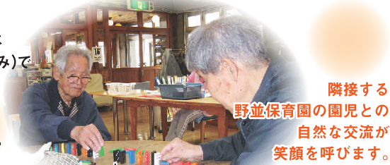
隣接する野並保育園の園児との自然な交流が笑顔呼びます。

野並デイサービスセンター 天白区福池2丁目340番地 http://www.nohonoho.com/index.html nonami.f@yk.commufa.jp