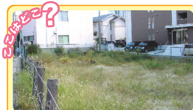
これは平成23年3月頃の、天白区内のある場所です。ある建物が建つ前の写真ですが、さあ、どこでしょう？ 答えは3面です。【昔の写真募集中!】