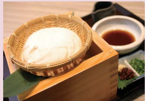
豆腐の味がダイレクトに楽しめる「ざる豆腐」

天白区中平にある『まるみや食品』では、無農薬で作られた国産大豆と沖縄産の天然にがり、天然の地下水を使って豆腐作りを行っています。そのアンテナショップとしてオープンしたのが