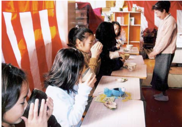
一杯の抹茶で心を落ち着かせるひととき(うえみなフェスタ)

およそ800人の児童が通う植田南小学校では、地域に支えられてのイベントや体験学習が自慢です。