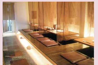
掘りごたつ式のテーブル席は年配の方にも人気

一昨年、店内をリニューアルし、掘りごたつタイプの個室が3室増えました。周りを気にせず、くつろぐことができると、親子連れや仲間うちで来店される方に好評です。ヘルシーだけでなく栄養価が高い豆腐料理、一度味わいに訪れてみませんか?