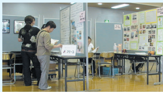
各施設の職員が相談に応じてくれます(施設情報展にて)