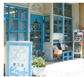
鮮やかな空色が店の目印

「子どもが好きな絵本に出会ったときの素敵な時間」を大切にしたいという思いから、約25年前にオープンした「夢文庫ピコット」。このあたりは当時から文化的なものへの関心が高く、新しい試みもされていて、そういった雰囲気の中でお店をオープンしました。ロングセラー絵本を中心に、育児書、紙芝居、パネルシアターや音楽CD、木のおもちゃなど、子どものための商品が所狭しと並んでいます。親子で実際に絵本を手にしなから「お気に入りの一冊」にたどり着けるよう店内には小さなテーブル