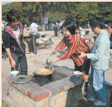
青空の下だとなべの味も格別です

今年も会員の親睦を深めるために、やみなべ交流会を11月17日に天白公園で開催しました。雲ひとつない青空の下、風もなく穏やかな陽気だったこともあり、総勢42名もの人でにぎわいました。おわんとはしを持参し、みんなが持ち寄った食材で、カレー・ちゃんこ・みその三種類のなべを作りました。今回、人気のあったなべは、みそ味でした。なべを囲んで話がはずみ、いろいろな人と交流できました。食後は、みんなでジェンカを踊って、楽しく過ごしました。