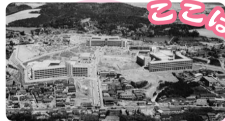
ここは昭和40年代に空撮された天白区内のある場所です。答えはP.3です。

近い将来発生すると言われている東海・東南海地震では、ライフラインが寸断されたり、地域の指揮系統が機能しないことが考えられます。混乱が予測される中で、私たち住民が主体となって行動することが大切です。