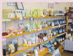
オイルの他、ハーブティーやオリーブを主成分にした化粧品も取り扱っています

営業時間: 午前10時~午後8時 定休日: 年中無休 住所: 天白区八事石坂135-2 TEL・FAX: 836-2314 URL: http://aidoma-aroma.com