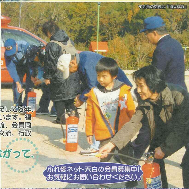
▼会員の交流会「消火体験」

この3月で「ふれ愛ネット天白」が発足して8年、「地域との交流」を中心に人の輪を広げています。福祉区民のつどいや防災企画を通しての交流、会員同士の交流、ボランティアをしたい方との交流、行政との交流などなど。