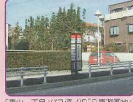
「表山一丁目」バス停(旧「八事遊園地」)

正解は、「船見遊園地」(天白区八事天道)です。昭和元年から十二年まで八事遊園地のそばにありました。名古屋で一番長い滑り台があり、敷物を有料で借りて滑りました。早くから鉄道が敷かれた八事一帯は、大正元年に競馬場、ポート場、猿園、ブランコ、滑り台などが設置された、名古屋で最大の行楽地でした。昭和八年、東山動物園ができてさびれてしまった遊園地。しかし、早くから発展した八事交差点周辺