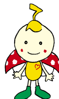
天白区社会福祉協議会 キャラクター 「てんてん」

福祉団体等の皆さんより申請をいただき、 書類選考により助成先・助成額を決定します。